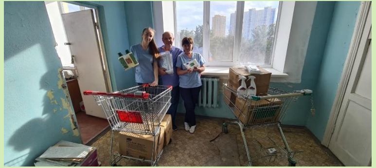
Met grote blijdschap ontvangen in het kinderziekenhuis in Kiev