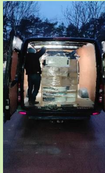
Uitladen in Oekraïne