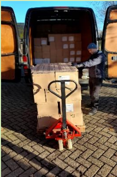
Inpakken in Holland