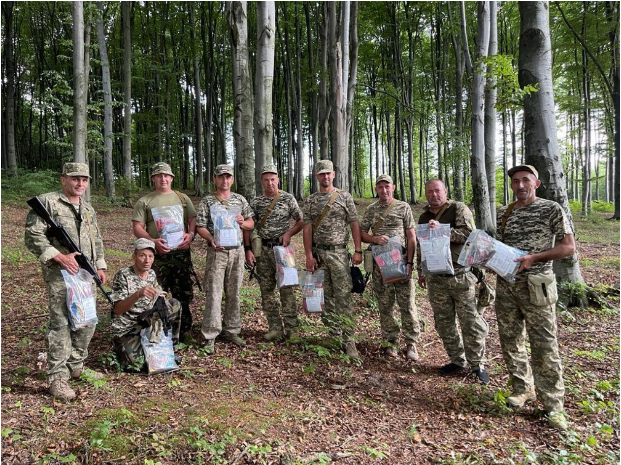
Oekraïense militairen met voedselpakketten

Ter plaatse ontmoetten wij de mannen die dagelijks aan het front voor de vrijheid van hun land vechten. Deze confrontatie betekende (en betekent) voor ons een extra motivatie om door te gaan met dit belangrijke werk!